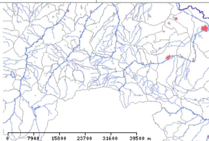
Escala gráfica embebida en el mapa generado